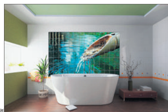
Dans la salle de bains ou dans la chambre, la photo choisie se fixe comme une mosaïque de catelles.

Pour profiter du service d'Okhyo, il suffit de choisir une image qui vous tient à cœur, de