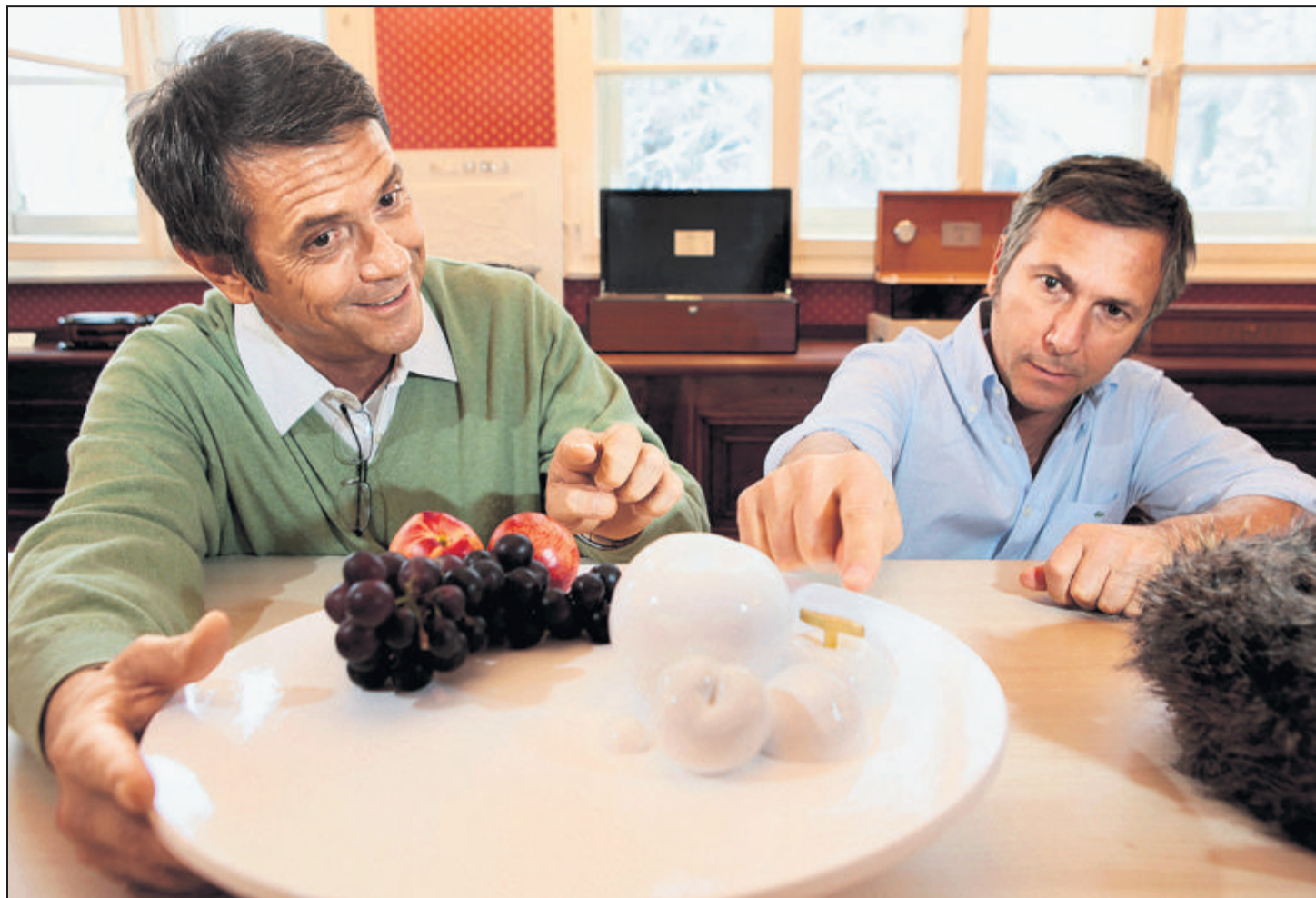
MENTORS Fernando et Humberto Campana ont inspecté vendredi dernier les créations de leurs élèves pour Reuge au cœur de l'usine. Parmi les prototypes: une coupe de fruits cachant un mécanisme de boîte à musique. SAINTE-CROIX, LE 5 FÉVRIER 2010

La neige tombait à gros flocons vendredi dernier sur l'usine Reuge, à Sainte-Croix. Un paysage polaire propre à dépayser et ravir Humberto et Fernando Campana. «C'est merveilleux, féérique! On dirait un film de Disney», s'émerveille le duo en piétinant le blanc manteau nord-vaudois. Les designers brésiliens – parmi les plus connus du milieu – ont quitté le sol de São Paulo dimanche passé pour diriger un workshop d'une semaine à l'Ecole cantonale d'art de Lausanne (ECAL). Supervisés par les mégastars («Ce sont nos idoles, des gourous!» témoignent les étudiants), quatorze élèves en master en Design et industrie du luxe (MAS-Luxe)